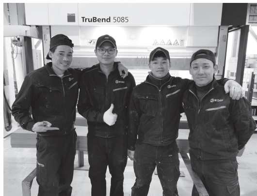
写真3 全員を多能工化し、少数精鋭を目指す

ない」といった基準で各項目の重要度を決定していった。これらの分析結果はExcelファイルにデータとして集約した。